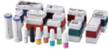
ブラザースタンプ (シャチハタタイプ)